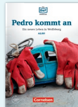
Pedro kommt an Ein neues Leben in Wolfsburg Mit Audios-Online 978-3-06-024442-3

Weitere Informationen und Bestandteile finden Sie auf: cornelsen.de/daf-bibliothek