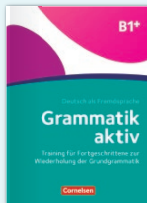
B1+ Übungsbuch B1+ 978-3-06-024470-6