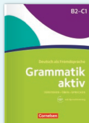
Übungsgrammatik B2-C1 978-3-06-021482-2