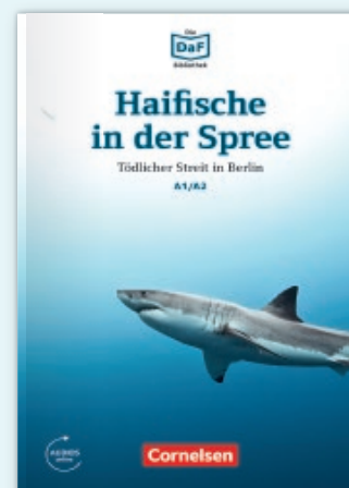
Haifische in der Spree Tödlicher Streit in Berlin Mit Audios online 978-3-06-120737-3

Die Storys spielen an realen Orten und führen die Leserinnen und Leser in verschiedene Städte und Regionen Deutschlands, Österreichs und der Schweiz. Mit Worterklärungen, Illustrationen, landeskundlichen Infos, Rätseln und Aufgaben bieten die Bände weit mehr als „nur“ Lektüre.