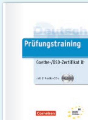
Prüfungstraining DaF Goethe-/ÖSD-Zertifikat B1 978-3-06-020897-5

Weitere Informationen und Bestandteile finden Sie auf: cornelsen.de/daf-pruefung