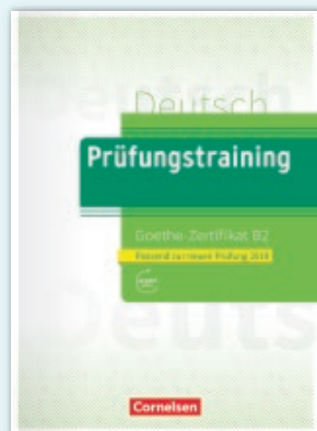
Prüfungstraining DaF Goethe-Zertifikat B2 978-3-06-121775-4

Die Prüfungstrainings eignen sich für den Einsatz im Unterricht ebenso wie für das eigenständige Lernen.