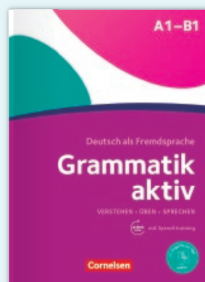
Übungsgrammatik A1-B1 978-3-06-023972-6

Die beiden Übungsgrammatiken sind ideal für alle, die die deutsche Grammatik auf den Niveaustufen B2 bzw. C1 des „Gemeinsamen europäischen Referenzrahmens“ wiederholen und vertiefen möchten. Sie eignen sich sowohl als begleitende Grammatiken im DaF-Unterricht als auch für das Selbststudium.