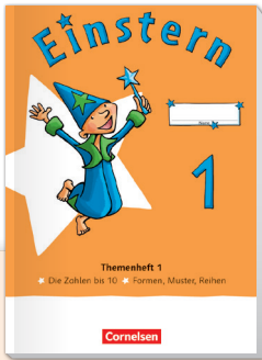
Einstern Ausgabe 2021

Digitales Angebot + interaktives Arbeitsheft Klasse 3–4 + Unterrichtsmanager Plus + E-Book mit Medien + kostenlose digitale Medien wie Erklärfilme und Handlungsmaterialien (Zwanzigerfeld, Schüttelbox, Uhr, Ziffernschreibkurs)