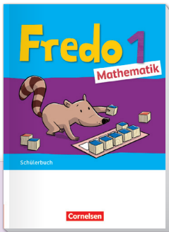
Fredo Ausgabe 2021

Digitales Angebot + Unterrichtsmanager Plus + E-Book mit Medien + kostenlose digitale Medien wie Erklärfilme, Check-Aufgaben und Handlungsmaterialien (Zwanzigerfeld, Uhr, Ziffern- schreibkurs)