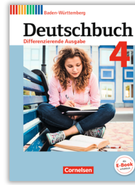
Deutschbuch Differenzierende Ausgabe 4 Klasse 8 978-3-06-067467-1