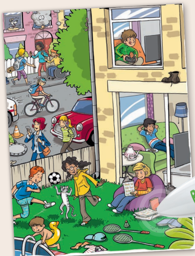
Verkleinerte Abbildungen aus Sunshine

Der BOOKii Hörstift hat viele tolle Funktionen und lässt sich ganz intuitiv bedienen, sodass Grundschüler sowohl im Unterricht als auch zu Hause eigenständig damit lernen können.