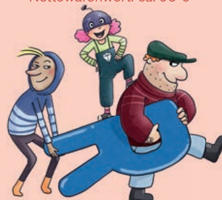
Illustration: Antje Hagemann