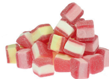
7. HAMBURGER SPECK

Kekse aus Honig, Zimt und Gewürzen. In Hamburg isst man sie gern auf einem Brötchen mit viel Butter.