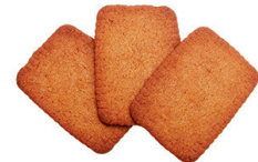
4. BRAUNE KUCHEN

Kekse aus Honig, Zimt und Gewürzen. In Hamburg isst man sie gern auf einem Brötchen mit viel Butter.