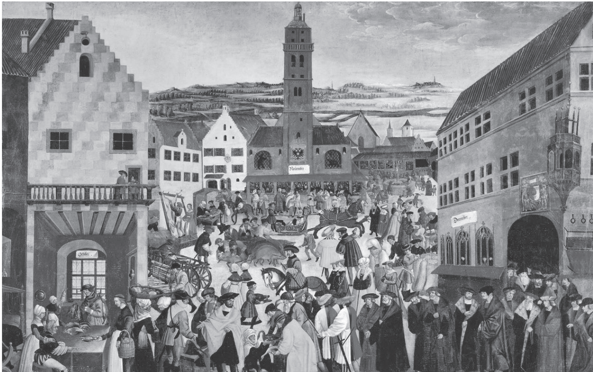
M1 Der Marktplatz von Augsburg , Ausschnitt aus einem Gemälde von Jörg Breu d. Ä., um 1530