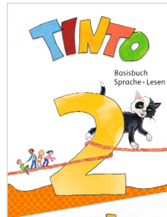
Tinto Sprachlesebuch, Neubearbeitung 2019 Basisbuch Sprache und Lesen 2, 9783060843459 / Basisordner Sprache und Lesen 2, 9783060843466 (alternativ zu verwenden)