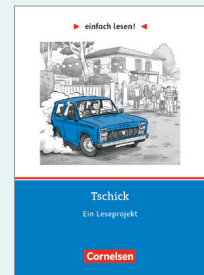
einfach lesen „Tschick“

Wenn es klassischer zugehen soll, dann ist die Reihe Einfach klassisch eine große Hilfe. Einfach klassisch ist die Lektüre für ungeübte Leserinnen und Leser. Die Texte sind gekürzt und behutsam sprachlich vereinfacht, bleiben dabei aber dennoch nah am Original. Einfach klassisch erleichtert den Zugang zu den Klassikern und weckt das Lesevergnügen, gerade im Fernunterricht.