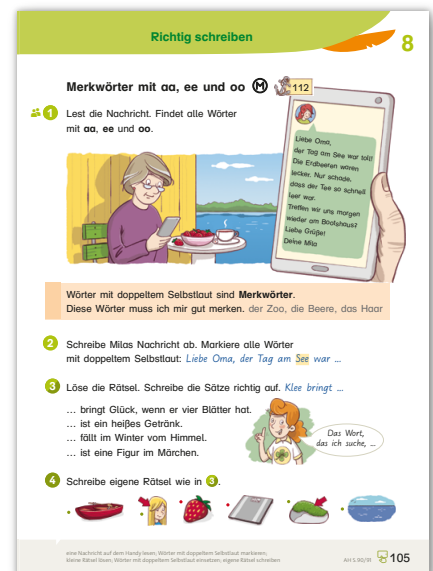
Seitenausschnitt aus Deutsch mit Olli , Sprachbuch, Klasse 2

Beispiel aus der Kategorie „Einsichten gewinnen: sich mit Schreibweisen auseinandersetzen“ Übungsformat: Besonderheiten finden und markieren