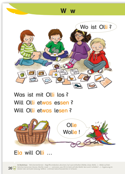
Seitenausschnitt aus Deutsch mit Olli , Fibel

Beispiel aus der Kategorie „Kontextualisieren: Übungswörter einbinden“ Übungsformat: Sätze mündlich bilden