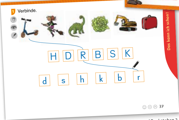
Beispielseite aus Erstlesen: Laute und Buchstaben 2