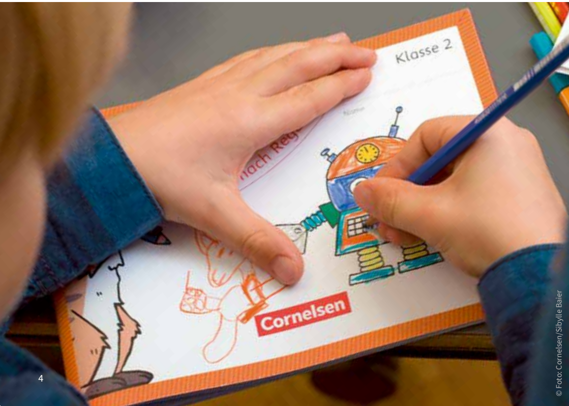
Beispielseite aus Deutsch 2: Schreiben nach Regeln