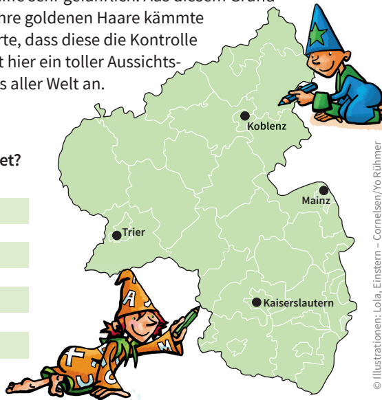
© Illustrationen: Lola, Einstein – Cornelsen/Jo Rühmer © Illustrationen: Fredo – Cornelsen/ Martina Theissen, Ermännchen – Cornelsen/Josephine Wolff

Am höchsten, am tiefsten, am längsten, am größten