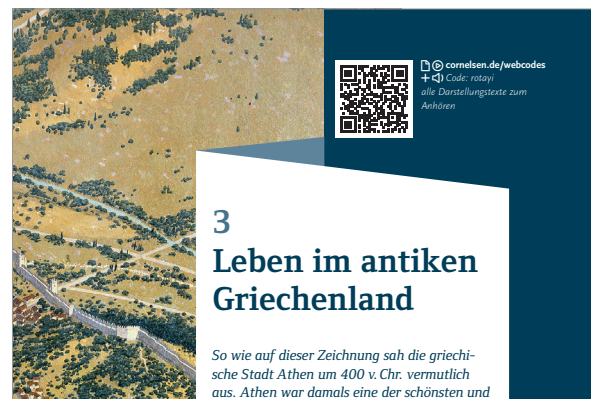
978-3-06-065615-8, Forum Geschichte , Schülerbuch, Ausschnitt S. 67