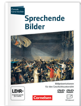
978-3-06-065211-2 DVD Sprechende Bilder

Auch in vielen UMAs werden Videos der Sprechenden Bilder als Zusatzmaterial angeboten.