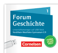
978-3-06-065618-9 Forum Geschichte, UMA