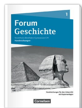
978-3-06-065616-5 Forum Geschichte, HRU