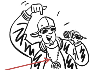
une chaîne 1 de rappeur.