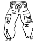
un pantalon baggy.